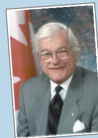
SENATOR TOMMY BANKS