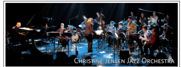
CHRISTINE JENSEN JAZZ ORCHESTRA